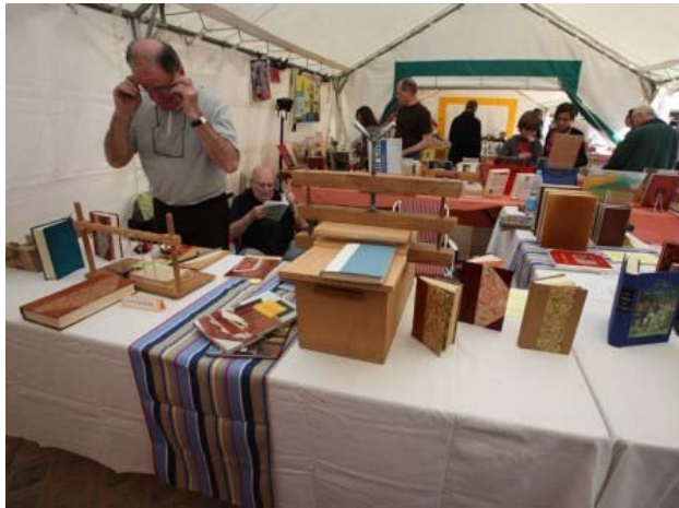
L'association "Le cercle Universitaire" présente son atelier de reliure